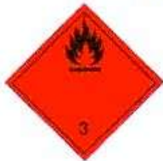
Легковоспламеняющиеся жидкие вещества