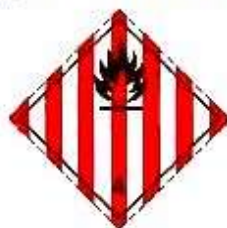
Легковоспламеняющиеся твердые вещества, самореактивные вещества и десенсибилизированные взрывчатые вещества