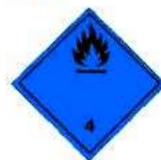
Вещества, выделяющие легковоспламеняющиеся газы при соприкосновении с водой