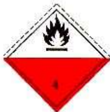
Вещества, способные к самовозгоранию